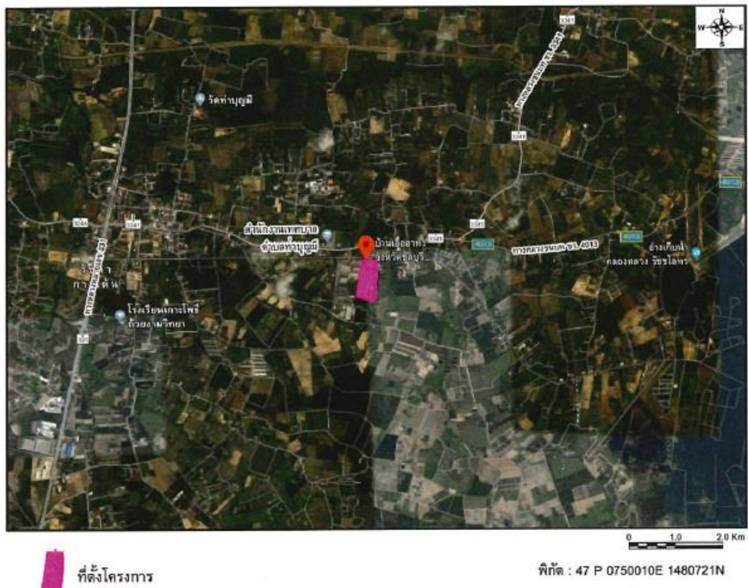
รูปที่ 1.2-2 ที่ตั้งของโครงการ